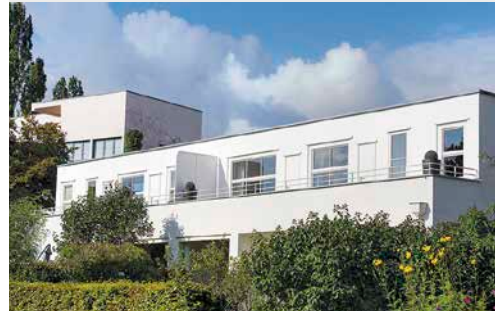
Stuttgart, Weißenhofsiedlung oben: Haus J. J. P. Oud unten: Haus Josef Frank