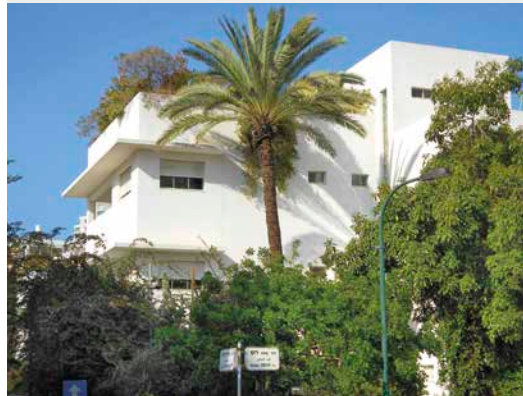
25 Idelson St., Tel Aviv, 1931, Richard Kauffmann